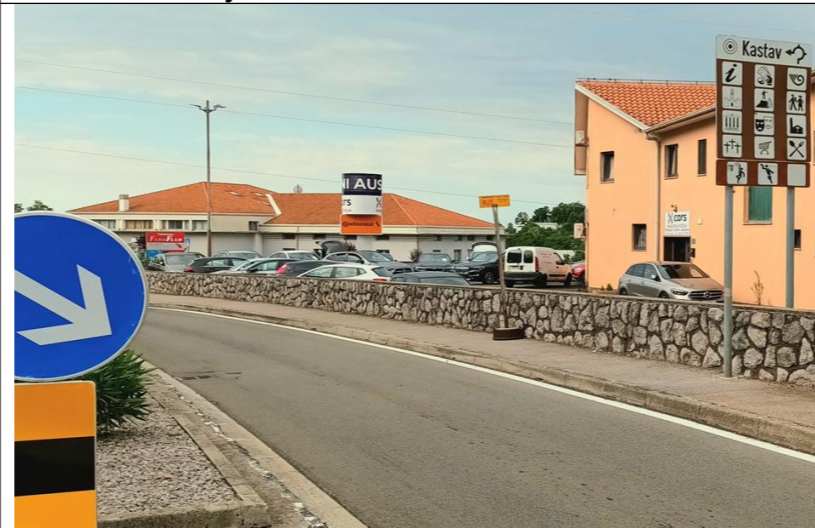
Privremeno stajalište Belići