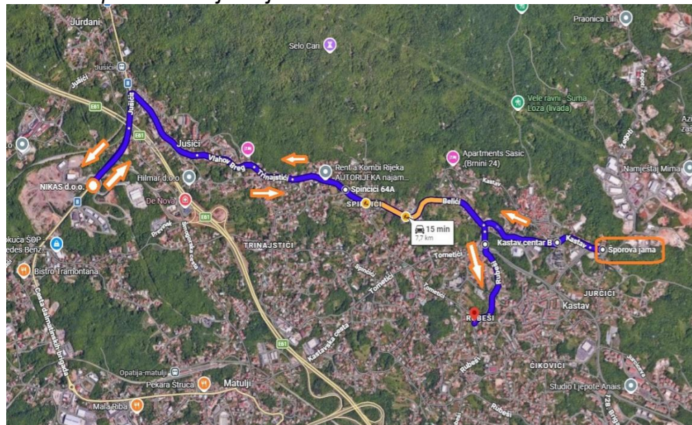
Trasa prometovanja linije 18 i 18A